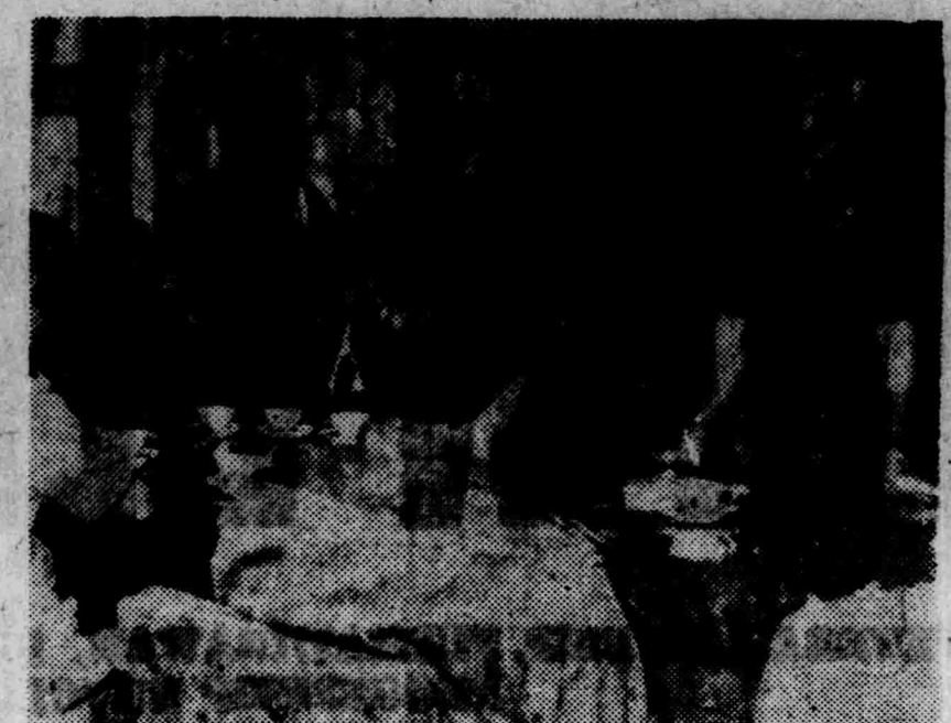
...an Mubes Nasional ke-III Angkatan '65 Selasa pagi bertempat di Presidium telah ditinjau oleh Ketua Presidium Djenderal Suharto dan telah menyerahkan 'Tugas Angkatan '65' kepada Pak Harto...